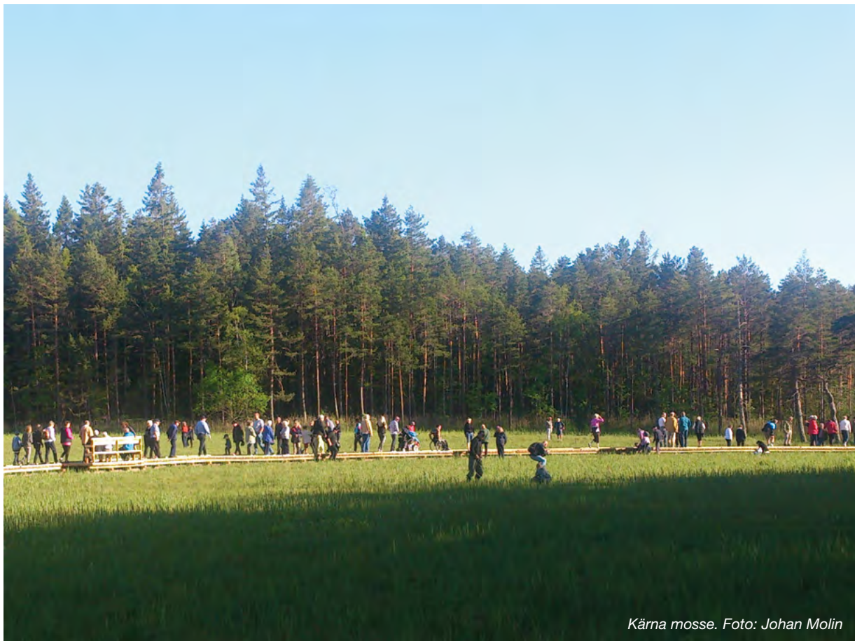
Kärna mosse.

Högkvalitativ information om natur och naturvård utvecklas kontinuerligt och sprids via flera informationskanaler. Förutsättningarna för ett aktivt deltagande i naturvårdsarbetet för olika intressenter är goda