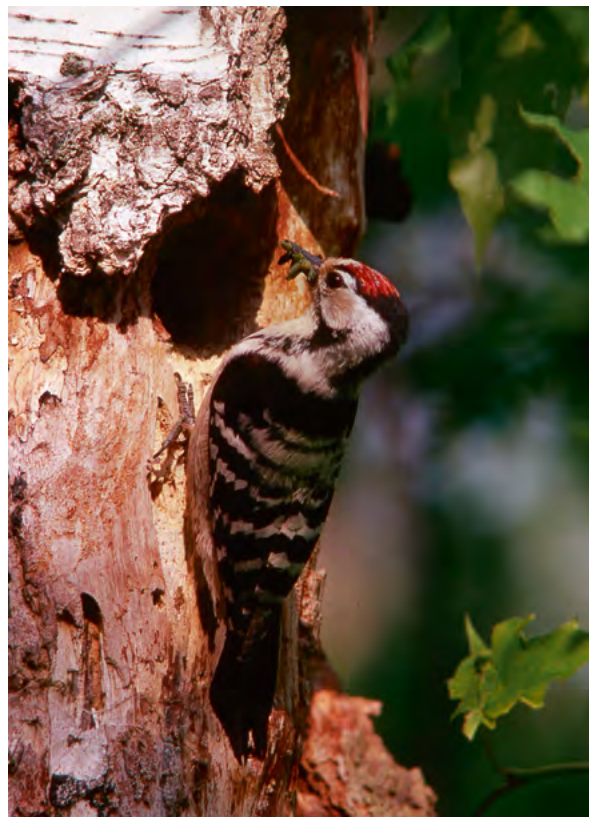
Mindre hackspett.

I naturvårdsprogrammet ges mer bakgrund kring naturvården i Linköpings kommun. Vill man