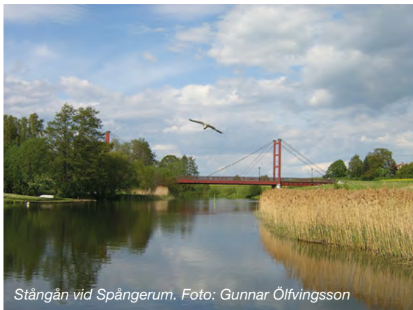
Stångån vid Spångerum.

Städer, tätorter och annan bebyggd miljö utgör en god och hälsosam livsmiljö och bidrar till en god regional och global miljö. Natur- och kulturvärden tas till vara och utvecklas. Byggnader och anläggningar lokaliseras och utformas så att en långsiktigt god hushållning med mark, vatten och andra resurser främjas