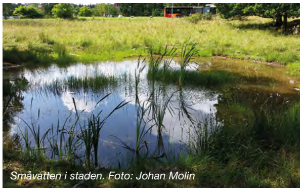
Småvatten i staden.

Våtmarkernas ekologiska och vattenhushållande funktion i landskapet är bibehållna och värdefulla våtmarker bevaras och utvecklas