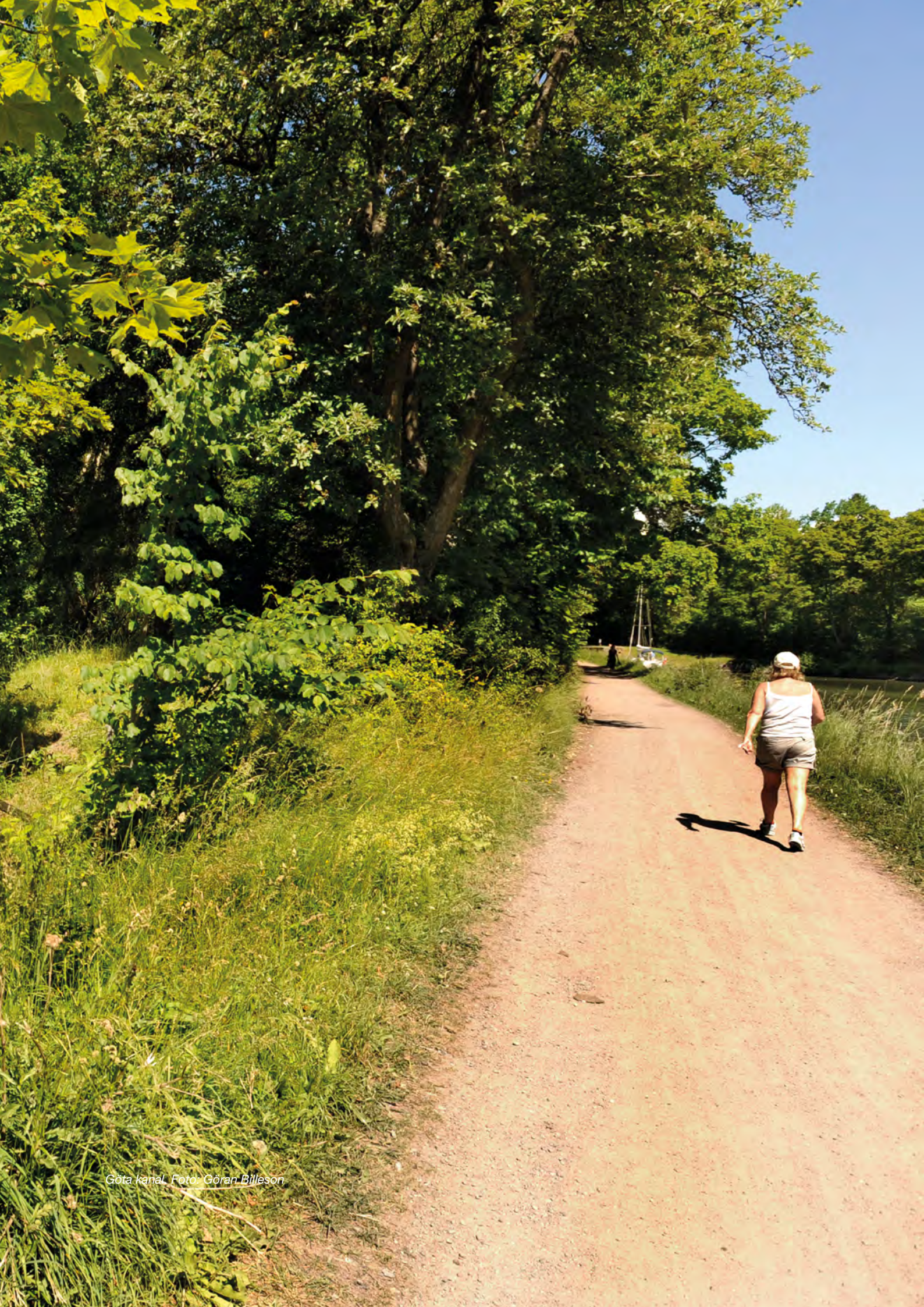
Göta kanal.