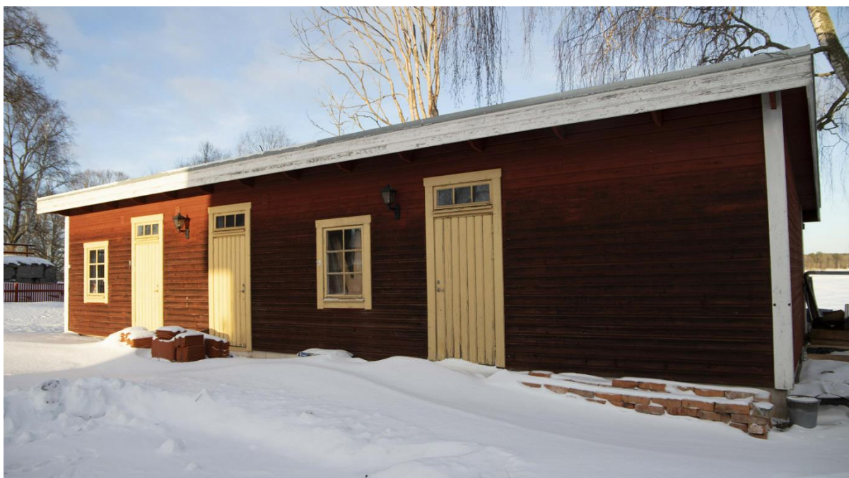
Uthuset inom fastigheten.

Bebyggelsen i Örtomta utgörs av småhus i anslutning till kyrkan. Ett klocktorn återfinns inom kyrkofastigheten i angränsning till planområdet.