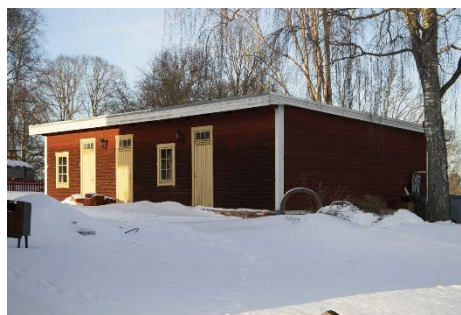
Planområdets lokalisering i Örtomta samt bebyggelsen inom fastigheten.