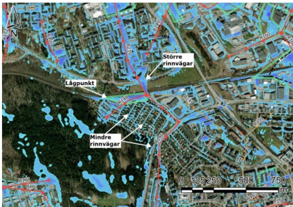
Figur 4. Utdrag ur skyfallskartering, Ramböll 2023. Underlaget illustrerar större och mindre rinnvägar som uppstår vid skyfall och används som internt planeringsunderlag.

För att bättre kunna bedöma åtgärdsbehov för resterande verksamhetsområden behöver även skyfallskartering för dessa områden genomföras.