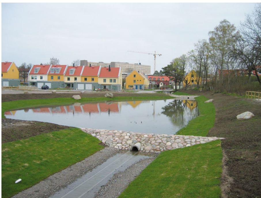
Figur 3. Dagvattenstråk Tinnerbäcksgård

Fastighetsägarens ansvar regleras bland annat i lagen om allmänna vattentjänster och kommunens allmänna VA-bestämmelser (ABVA).