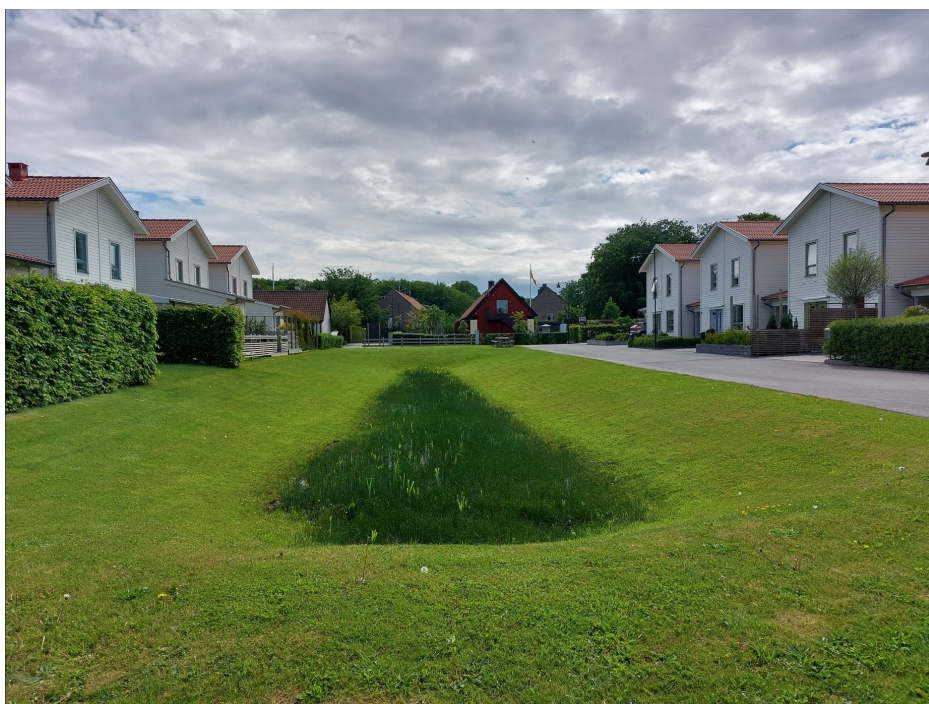
Figur 2. Dagvattenåtgärd (svackdike) i villaområde.

Att ta hand om dagvatten på ett hållbart sätt är viktigt för att minska risken för översvämningar och begränsa spridningen av föroreningar till sjöar och vattendrag. Dagvatten bör ses som en resurs och tas omhand så nära källan som möjligt.